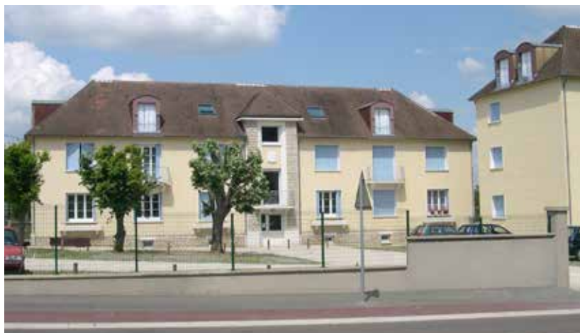
Résidence Jeanne Hérold à Auzerre

L'auditeur adressera son rapport d'audit à l'AFNOR prochainement. Une commission statuera alors sur le renouvellement officiel de notre certification.