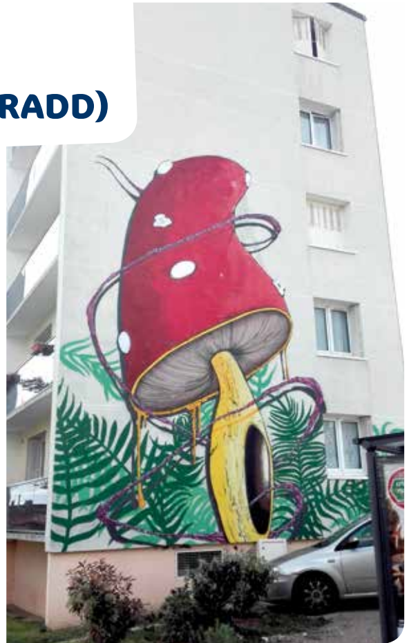
Résidence St Georges.