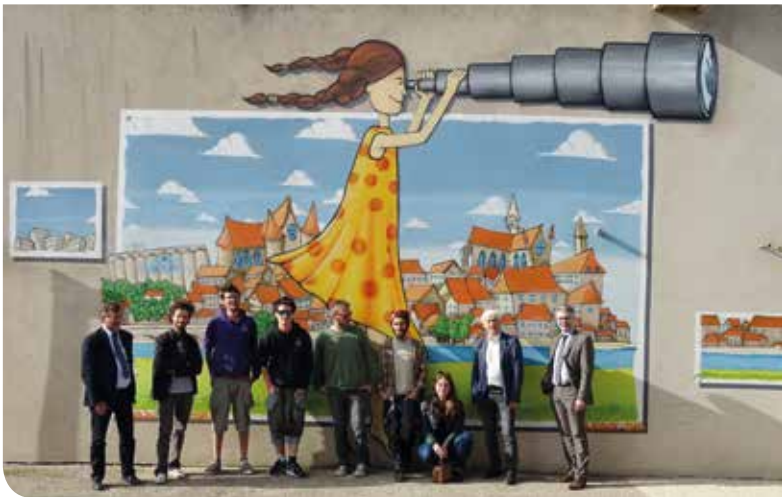
Mur de la chaufferie place Corot.

Pour la 10 ème année, du 25 au 28 avril dernier, se sont tenues les Rencontres Auxerroises du Développement Durable (RADD). Ainsi, comme l'an passé, le groupe Crazy Spray a réalisé une fresque sur l'un des murs de la résidence St Georges à Auxerre et sur le mur de la chaufferie située place Corot à Auxerre. Ces fresques ont été inaugurées officiellement le 26 avril dernier.