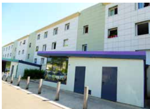
Place Corot à Auzerre

DEPUIS LE 13 AVRIL 2018, LA VERSION 3 DE QUALIBAIL EST DISPONIBLE